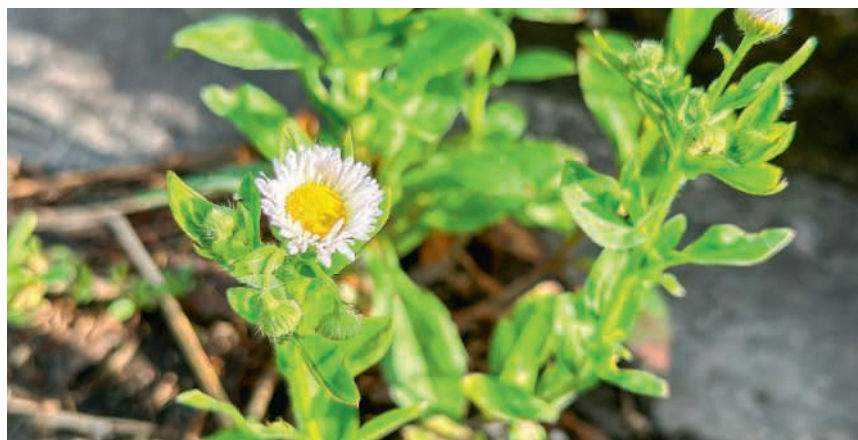
Zur Tilgung benötigt man 20 Sekunden

Der Zoo beherbergt derzeit 321 Tierarten und rund 8000 Tiere auf 27 Hektaren. Jährlich besuchen ihn 1,33 Millionen Menschen, darunter viele Schülerinnen und Schüler. Der Erlös des von der Kulturkommission Hausen AG organisierten Abends geht an ein Projekt des Zoos Zürich.