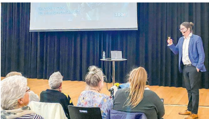
Der Zoo Zürich ist auch ein Bildungsinstitut

Der Seniorenflug vom Freitag, 29. Mai, stösst auf grosses Interesse. Innert kürzester Zeit waren sämtliche Plätze vergeben, weshalb keine weiteren Anmeldungen mehr entgegengenommen werden können. Es freut uns sehr, diesen Ausflug mit einer so grossen Gruppe durchzuführen. Die Teilnehmenden besammeln sich um 9 Uhr beim Gemeindesaal. Nach der Anwesenheitsüberprüfung erfolgt die Abfahrt um 9.30 Uhr. Die Rückkehr ist gegen 17.30 Uhr vorgesehen. Wir hoffen auf Ihr Verständnis und freuen uns auf den nächsten Anlass mit Ihnen.