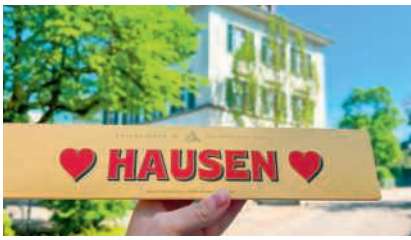
Hausen AG lädt zur Gemeind