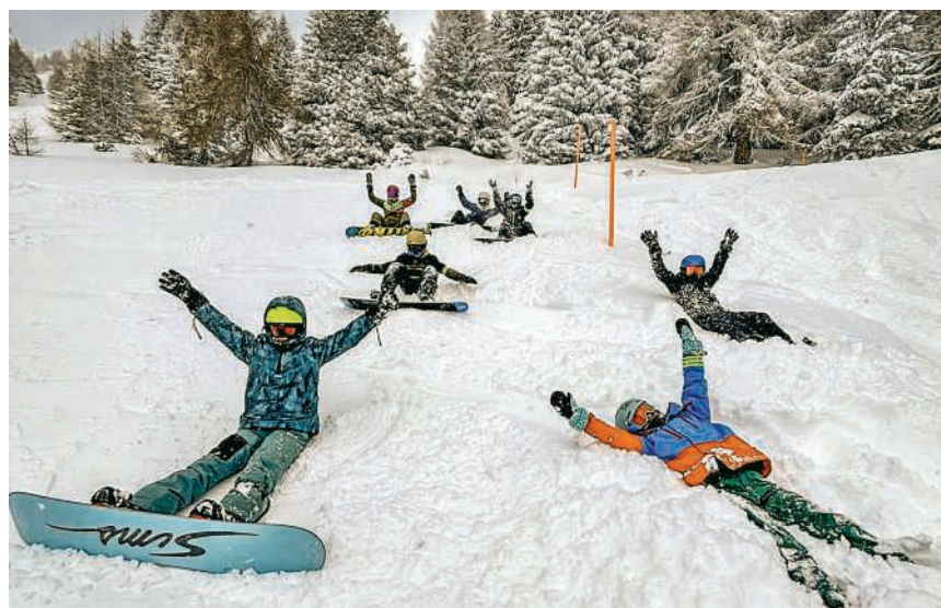
Freude pur im Schnee

Fairness, Einsatz und mit vielen lachenden Gesichtern. Ein grosses Dankeschön an alle Leitungspersonen, die diese Woche möglich gemacht haben. Besonders geschätzt wurden zudem die ausgezeichnete Zusammenarbeit im Team sowie die positive Atmosphäre, die stets spürbar war. Viele Kinder erzählten noch Tage später begeistert von ihren Erlebnissen, was zeigt, wie nachhaltig diese Sportwoche wirkt.