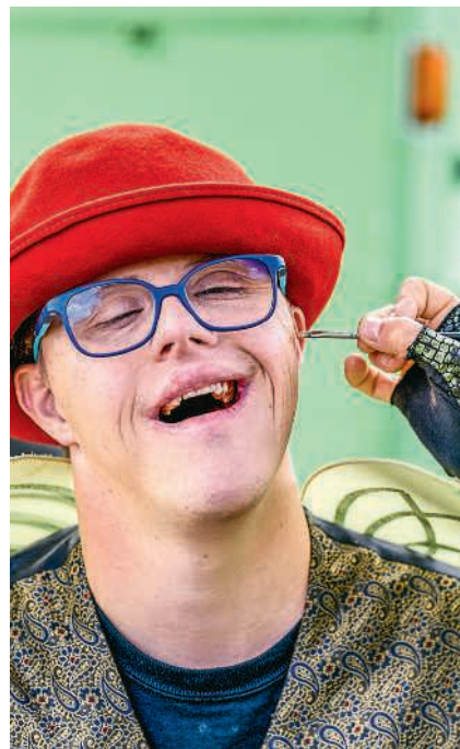
Circolino Pipistrello

Wir freuen uns auf diese spannende Woche ausserhalb der Gewohnheiten und einiger Komfortzonen, auf neue Begegnungen und ein geselliges, gaukelndes, durchmisches Miteinander im Herzen von Hausen AG.