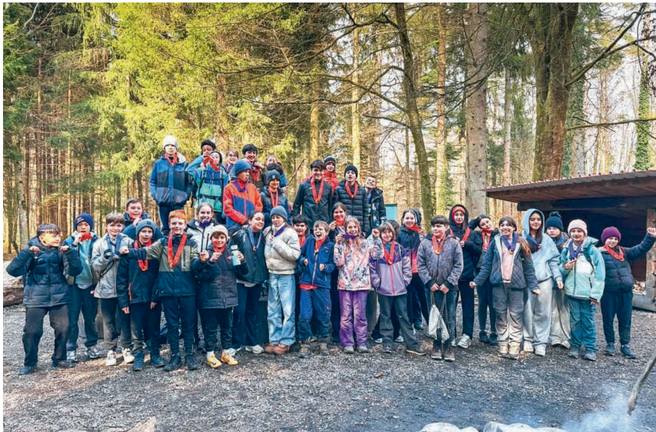
Zum Abschluss im Wald

Der Mittwoch stand im Zeichen von Spiel und Spass in den Turnhallen. Hallenspiele sorgten für Bewegung, Teamarbeit und viele lachende Gesichter. Am Freitag ging es noch-