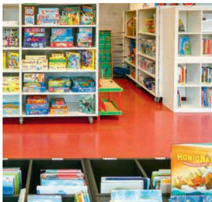
Neue Duplo und Spiele sind bereit für viel Spielspass

Wir ergänzen unsere Ludothek laufend mit neuen Spielen und Spielsachen. Neuerdings stehen viele coole Duplo-Sets für unsere jüngste Kundschaft bereit, die zum Ausleihen einladen. Für Spielfans ab acht Jahren sowie für Erwachsene haben wir zudem weitere kleine, feine Kartenspiele, die sicherlich für die eine oder andere Herausforderung sorgen. Wer zockt zum Beispiel besser beim Skull? Spielspass ist garantiert. Gerne beraten wir Sie und helfen Ihnen, passende Spiele zu finden. Ab dem 9. Mai ist das Freibad Heumatten in Windisch wieder geöffnet. Auch in diesem Jahr sorgen wir gemeinsam mit der Bibliothek Windisch für Unterhaltung mit der Badi-Bibliothek. Im Regal bei den Umkleidekabinen finden Sie für jeden Geschmack die passende Lektüre, die Ihren Sommer noch genussvoller macht. Wenn Ihnen ein Buch besonders gefällt, dürfen Sie es gerne mit nach Hause nehmen und behalten. Weitere Sommerlektüre finden Sie in der Bibliothek oder auf ebook+. Beachten Sie, dass die BibliLudo an Aufahrt, 15. Mai, geschlossen ist. Am Samstag danach sind wir wieder wie gewohnt für Sie da und freuen uns auf Ihren Besuch.