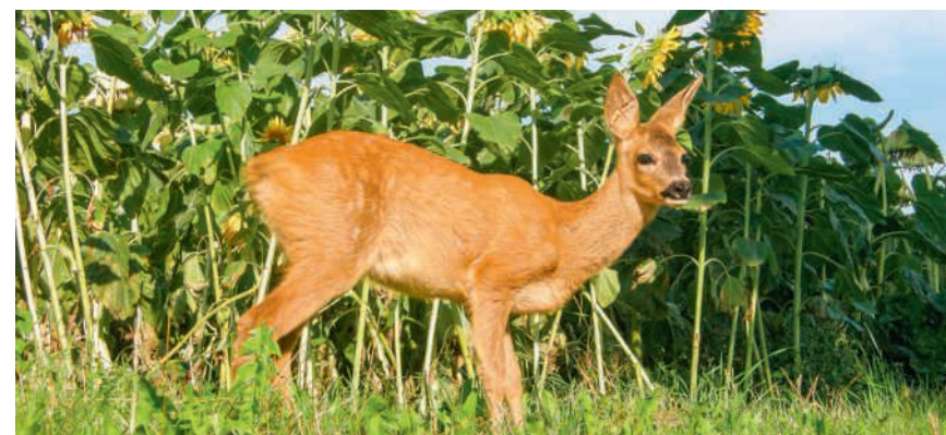
Eine Rehkitzrettung live erleben

Hausen AG ist von Wald umgeben. Im Osten vom Gebiet Rothübel-Lindhof-Eitenberg, im Westen vom Habsburgerwald. Daran grenzt die freie Flur. Der Übergang vom Wald ins Feld spielt eine wichtige Rolle für das Wild – besonders in den nächsten Wochen. Denn Rehgeissen gebären ihre Jungen lieber in Wiesen mit hohem Gras, wo die Jungtiere besser versteckt sind, als auf dem Waldboden. Aber sobald das Gras gemäht wird, sind die Kitze gefährdet. Die Jäger sorgen vor und veranlassen die Tiermütter mit ihren Jungen, die Wiesen rechtzeitig zu verlassen. Dabei suchen sie die Mäh-