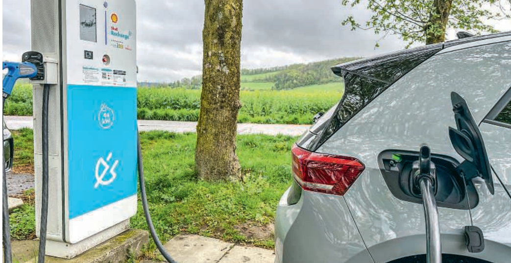
Die Energiekommission beschäftigt sich auch mit Lademöglichkeiten für Elektroautos

Die Gemeinde verfügt über eigene PV-Anlagen bei der Mehrzweckhalle, beim Werkhof, seit 2025 beim alten Lindhofschulhaus und ab 2027 auch beim Mehrfamilienhaus Mitteldorf-