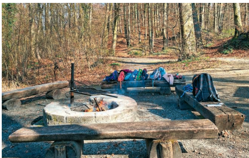
Spielerische Erfahrungen in Raum und Wald

Ein besonderes Anliegen der Spielgruppe ist es, die Kinder sanft, liebevoll und ohne Druck auf den Kindergarten vorzubereiten, idealerweise etwa ein Jahr vor dem Kindergarten-eintritt. Weitere Informationen finden Sie unter schnaeggehuesli-hausen.ch oder schreiben Sie uns per E-Mail an: info@schnaeggehuesli-hausen.ch . Wir freuen uns auf viele Kinder.