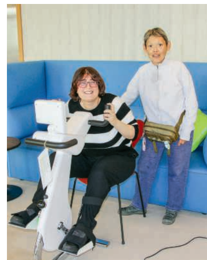
Beliebtes Gerät bei Bewohnenden und Mitarbeitenden

Die Abschlussveranstaltung ist das Familienkonzert am Sonntag, 14. Juni, um 15 Uhr in der Mehrzweckhalle Hausen AG. Die Musikgesellschaft bringt die Geschichte vom geheimnisvollen «weissen Gold» klingend auf die Bühne. Als besonderer Höhepunkt tritt das Jugendorchester Windissimini als Gastformation auf. Der Eintritt ist frei, und im Anschluss lädt ein Apéro zum Verweilen ein. Weitere Informationen zum Projekt finden Sie auf der Webseite mg-hausen.ch/Kontakt/Familienkonzert .