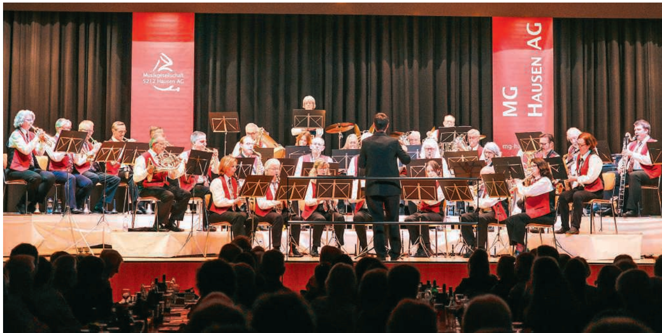
Tierisch gute Stimmung beim Jahreskonzert am 14. März