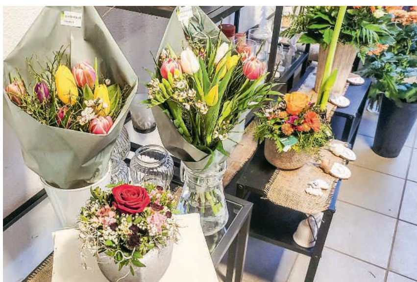
In unserem Blumenladen finden Sie Frühlingsblumen zum Verschenken

Möchten Sie einem besonderen Menschen zum Valentinstag eine Freude bereiten? Dann sind Sie bei uns an der richtigen Stelle. Unabhängig davon, ob Sie Rosen, Tulpen, liebevolle Blumengestecke, kreative Dekorationsartikel oder einen schönen Blumenstrauß suchen, wir sind am Valentinstag durchgehend von 7.30 bis 17 Uhr für Sie da. Ab einem Betrag von 30 Franken bieten wir gar einen kostenlosen Hauslieferdienst in Hausen AG und der Umgebung an.