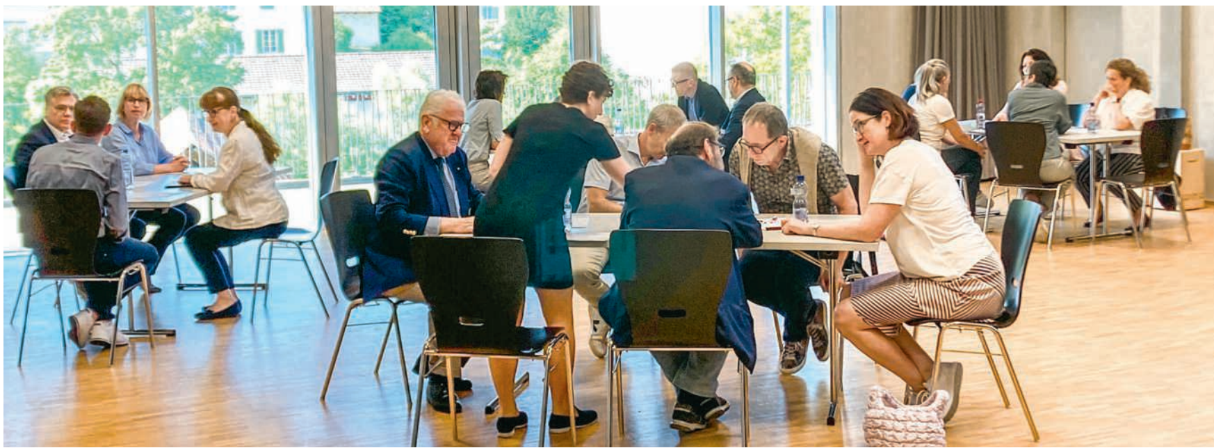
Workshop mit Leistungserbringern