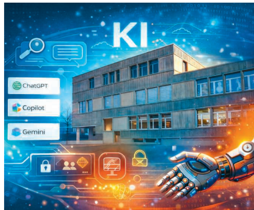
Schule trifft auf künstliche Intelligenz: KI-generiert.

Der Fokus lag auf den Grundlagen der Nutzung generativer Sprachmodelle wie ChatGPT, Copilot oder Gemini. Eigene Erfahrungen und kritische Fragen waren ausdrücklich erwünscht. Im anschließenden Austausch standen konkrete Anwendungen im Fokus, etwa Chatbots als Schreibhilfen, Werkzeuge zur Ideen-