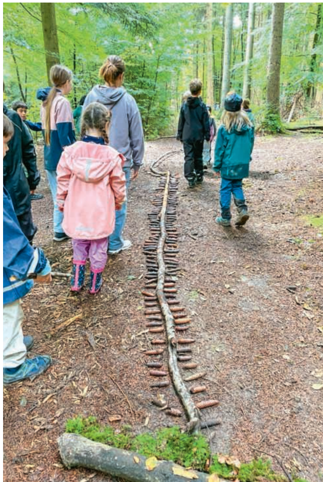
Tausendfüssler - Krabbeltiere im Wald (rechts) und Tannzapfenfigur

So half der Tausendfüssler mit seinen vielen Beinen, meist zwischen 100 und 400, auf anschauliche Weise dabei, grössere Zahlen begreifbar zu machen. Aus Naturmaterialien gelegt, entstanden auf dem Waldboden fantasievolle Krabbeltiere. Die älteren Kinder unterstützten die Zweitklässlerinnen und -klässler beim Suchen geeigneter Stöcke oder Tannzapfen für die Beine und beim Abzählen. Dieses gemeinsame Tun erforderte Geduld, Zusammenarbeit und gegenseitige Unterstützung.