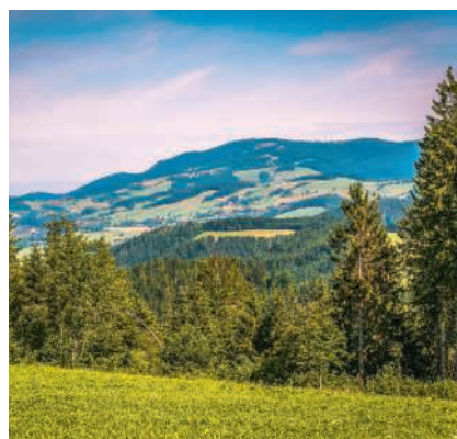
Durch den Schwarzwald