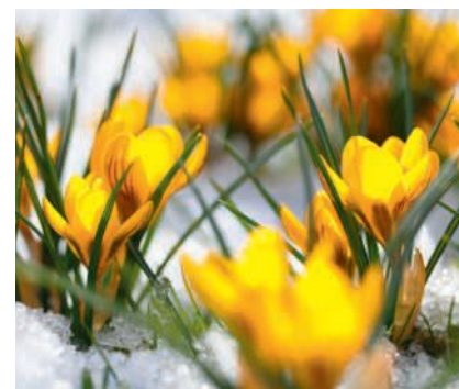
Krokus im Schnee