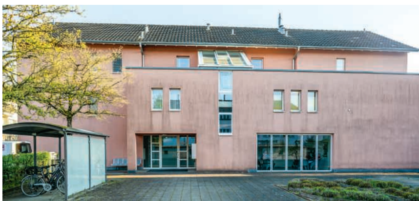
Die Wohnungen und auch die Gebäudehülle werden umfassend erneuert

Dabei geht es nicht nur um formelle Leistungserbringer, sondern auch um viel freiwillige Unterstützung. Die Zusammenarbeit aller Akteure soll der Bevölkerung durch bessere Information und koordinierte Angebote zugutekommen. Der Kanton hat eine Beteiligung von 80 % der Kosten signalisiert und will damit die Erfahrungen aus Brugg für andere Regionen nutzen. Obwohl zum jetzigen Zeitpunkt noch nicht alle Gemeinden gleich stark von den Herausforderungen betroffen sind, ist es wichtig, dass alle Gemeinden einbezogen sind und die Pilotphase mitgestalten, denn die Gemeinden sind zuständig für die Langzeitversorgung und für ein Alterskonzept. Die Region Brugg könnte damit Vorreiter für eine zukunftsfähige Altersversorgung werden.