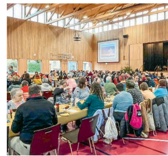
Festliche Atmosphäre und Verlosung der Geschenke (rechts)

Die bisherigen Waldmorgen waren für alle Beteiligten bereichernd, machten Freude und boten vielfältige Möglichkeiten, voneinander zu lernen. Kinder wie Lehrpersonen konnten davon profitieren. Umso mehr freuen wir uns auf die kommenden Waldmorgen und weitere gemeinsame Erfahrungen im Lernraum Natur.