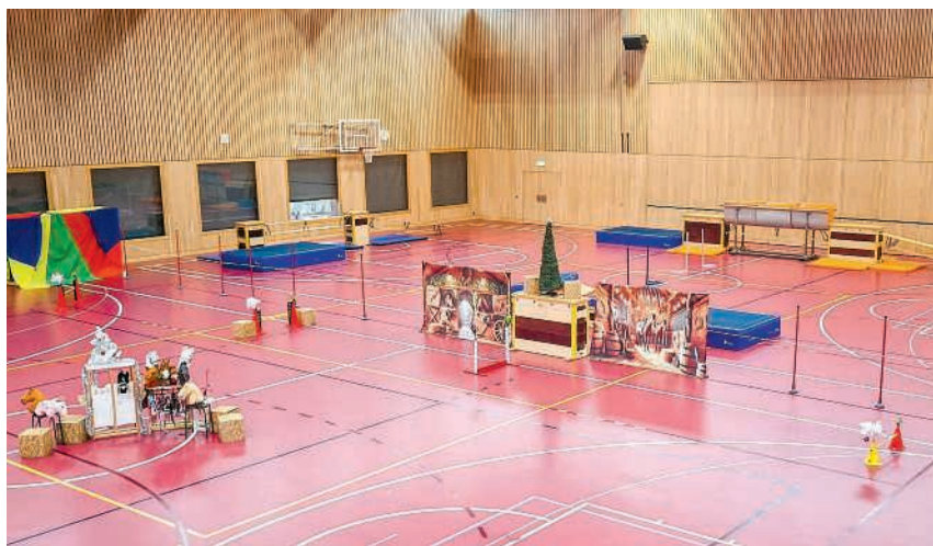
Hürdenlauf der anderen Art