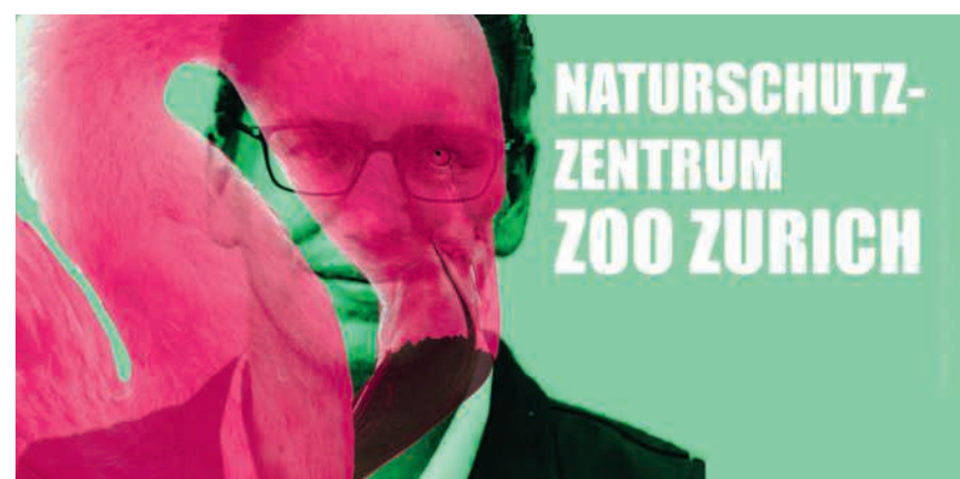
Der Zoo Zürich verzeichnet jährlich 1,27 Million Eintritte

Dressen spricht über die Geschichte und Entwicklung des Zoos Zürich sowie über die generelle Rolle zoologischer Gärten in der Gesellschaft. Er informiert über die vier Hauptaufgaben eines modernen Zoos: Artenschutz, Naturschutz, Forschung