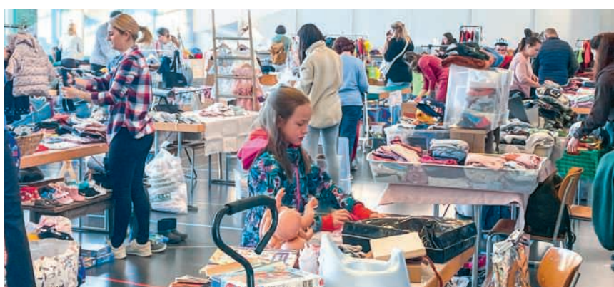
Buntes Treiben am Kinderflohmarkt

zeitig ist er ein geschätzter Treffpunkt für Familien aus der Region. Neu im Hausener Veranstaltungskalender ist die Flohmarktserie «Ladies Lounge - der Mädelsflohmarkt». Dieses neue Format richtet sich exklusiv an Frauen und lädt von 16 bis 20 Uhr zu einem entspannten Bummel in angenehmer Atmosphäre ein. Im Mittelpunkt stehen Mode, Accessoires und besondere Fundstücke - ganz nach dem Motto «von Frauen für Frauen». Neben dem Stöbern bietet die «Ladies Lounge» auch Raum für Austausch, Begegnung und gemütliches Verweilen. Anmeldungen sind per E-Mail möglich: Für den Kinderflohmarkt an kinderflohmarkt@hausener.ch, für die «Ladies Lounge» an ladieslounge@hausener.ch.